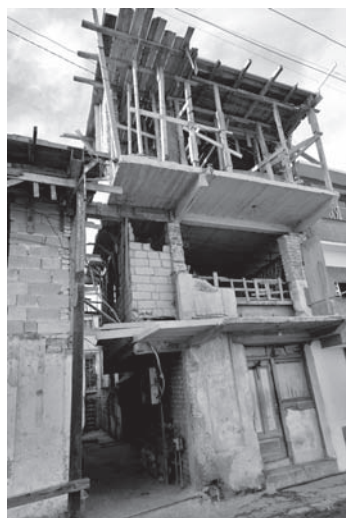
FOTO 2. IMAGEN DE UN EDIFICIO DE VIVIENDAS MUY DETERIORADO, A DOBLAR DEL CAPITOLIO PICTURE 2. HEAVILY DETERIORATED BUILDING NEAR THE CAPITOLIO BUILDING