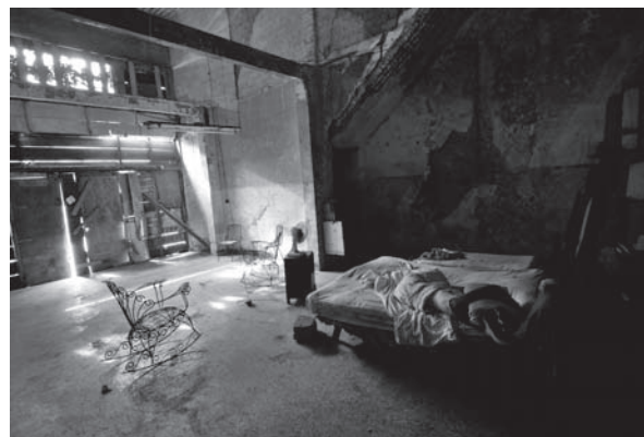
FOTO 4. TIENDA CONVERTIDA EN ALBERGUE EN EL CORAZÓN DE CENTRO HABANA PICTURE 4. STORE TURNED INTO A SHELTER IN HAVANA'S DOWNTOWN