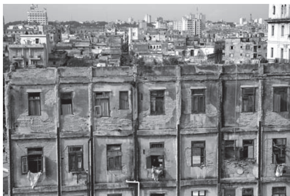
FOTO 2. IMAGEN DE UN EDIFICIO DE VIVIENDAS MUY DETERIORADO, A DOBLAR DEL CAPITOLIO PICTURE 2. HEAVILY DETERIORATED BUILDING NEAR THE CAPITOLIO BUILDING