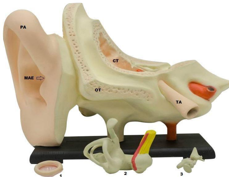
Figura 1. El modelo tridimensional AS-001, representa el oído humano: PA: pabellón auricular; MAE: meato acústico externo; CT: cavidad timpánica; OT: hueso temporal; TA: tubo faringotimpánico; 1: membrana timpánica (tímpano); 2; oído interno; 3: cadena de huesecillos.

embargo, sus dimensiones son superiores a las reales (ver tabla 1). El AS-001, pintado con colores diferentes para cada región (Fig. 1), fue tallado lo más próximo posible a las características originales de este órgano, reproduciendo así los lugares donde existe piel y hueso.